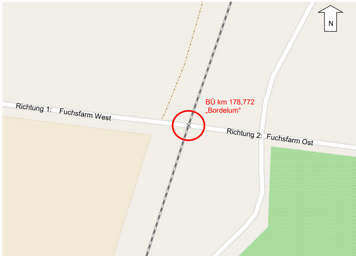
Abbildung 2: Übersicht Einmündungen am BÜ „Bordelum“ (Auszug OpenStreetMap 2020)