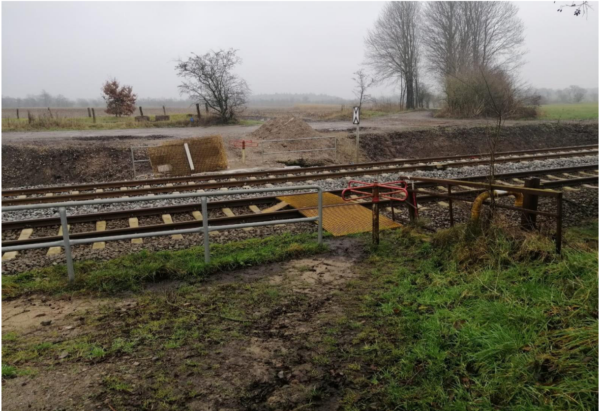
Abbildung 1: BÜ km 178,772 „Bordelum“, Strecke 1210, Gemeinde Bordelum Blick in Richtung Osten

Im Auftrag der DB Netz AG wurde eine Verkehrszählung am Bahnübergang km 178,772 „Bordelum“ in der gleichnamigen Gemeinde, auf der Strecke 1210 (Elmshorn - Westerland) durchgeführt.